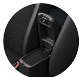
Amplios espacios de almacenamiento