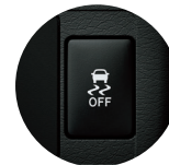
Control de Tracción (TRC) y control de Estabilidad (VSC)