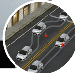
Frenos ABS con EBD y BA

Cuenta con bolsas de aire frontales con sensores que miden la fuerza y ubicación del impacto para activarlas de manera efectiva.