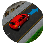
Asistente de arranque en pendientes (HAC)