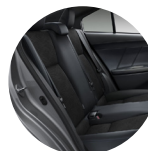
Asientos de tela de alta calidad