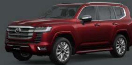
Dark Red Metallic