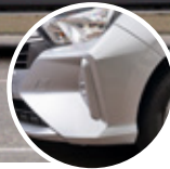
Proporciones ágiles de Go-Kart con voladizos cortos

El nuevo Toyota Agya llega con un estilo poderoso y agresivo con características de un auto deportivo amplio. Destacándose por su diseño ergonómico, su versatilidad y eficiencia el nuevo Agya viene con un look totalmente distinto, con una mirada renovada y aguerrida que cautivará donde lo vean y te dará la seguridad de manejar tu primer Toyota.