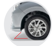
Gran Altura al piso