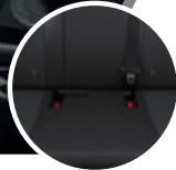
Asientos con anclaje ISOFIX

Si nos adentramos un poco más en seguridad, podemos contar con 2 airbags SRS para conductor y copiloto. Está equipado con un sistema de frenos ABS+EBD, control de tracción (TRC) y de estabilidad (VSC), asistente de arranque en pendiente (HAC), cinturones de seguridad (3 puntos) de última generación, bloqueo de protección infantil, ISOFIX. Características que generan confianza y tranquilidad al conducir un Toyota.