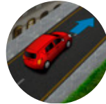
Asistente de arranque en pendientes (HAC)