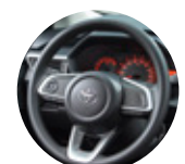
Volante regulable en altura, con mandos incluidos, con dirección eléctrica EPS