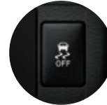
Control de Tracción (TRC) y control de Estabilidad (VSC)