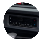
Aire acondicionado digital, bloqueo central y vidrios eléctricos.