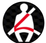
Alerta de cinturón abrochados para 5 pasajeros