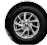
Aros de aluminio rin 14"